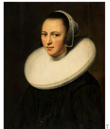
1. ルーカス・クラーナハ(子)《聖母子》 2. アンソニー・ヴァン・ダイク《エジプトへの逃避途上の休息》 3. カルロ・ファッキネッティ《母性愛》 4. フリッツ・ツーバーニビューラー《花環の少女》 5. エミール・プラク《白いドレスの少女の肖像》(1886年) 6. ジョシュア・レノルズ《ネリー・オブライエン嬢の肖像》 7. レンブラント・ファン・レイン《髻襟を着けた女性の肖像》(1644年)