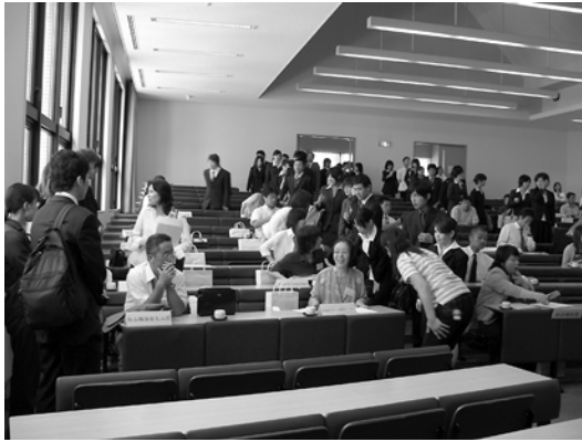
社会福祉実習連絡会 [6/26(火)]