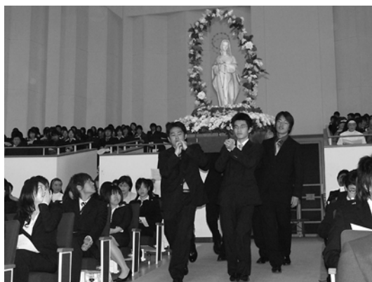
母をたたえる日 [5/15(火)]