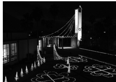
(昨年のイルミネーション)