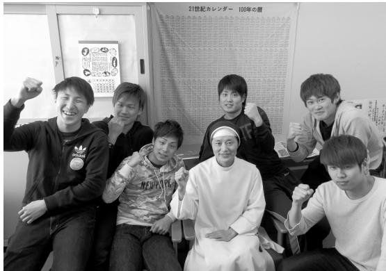
研究室「21世紀カレンダー」の前でゼミのみなさんと

私の研究室の壁には、「21世紀カレンダー 100年の暦」があります。十数年前、大学に着任した頃たまたま実家で見つけたのですが、装飾用の風呂敷らしく、大きな正方形の布に2001年から2100年までのカレンダーが刷り込まれているものです。文字通り「大風呂敷を広げる」ことになってはいませんが、見るたびに、まさに今の学生さん一人ひとりがこの21世紀の主役になることを思い、毎日その未来に向けて皆に関わっていくことを自覚するよう促されます。